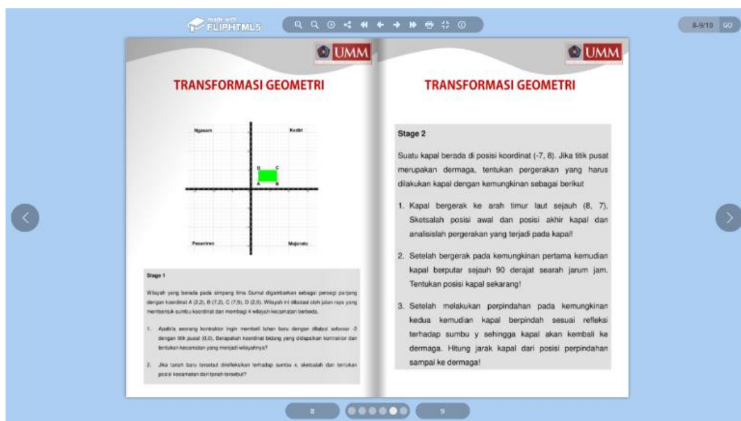
Gambar 3. Soal Tes

Halaman berikutnya menampilkan soal tes seperti yang termuat dalam gambar 3. Soal tes berupa esai sebanyak 5 soal. Soal dibagi ke dalam 2 kasus contoh untuk dievaluasi. Semua soal yang dihadirkan merupakan soal cerita yang dapat menggali kemampuan literasi numerasi siswa. Soal tes dapat dikerjakan secara mandiri oleh siswa, serta dapat digunakan sebagai bahan diskusi dengan siswa lain.