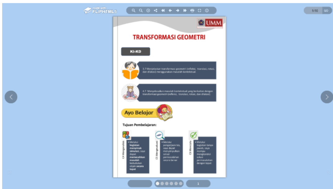
Gambar 1. KI-KD dan Tujuan Pembelajaran

Halaman pertama modul menampilkan Kompetensi Inti dan Kompetensi Dasar, serta tujuan pembelajaran seperti yang ditunjukkan pada gambar 1 .