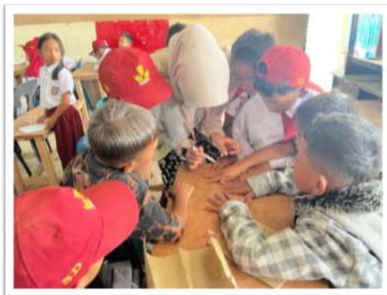
Gambar 1. Program Kerja Kebersihan