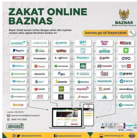
Gambar 1. Mitra Digital BAZNAS RI

ibadah seperti zakat 18 . Saat ini perpaduan sistem penghimpunan zakat dengan FinTech melahirkan istilah digital zakat yang sedang populer dikalangan millennial terutama pasca Pandemi Covid-19 19 .